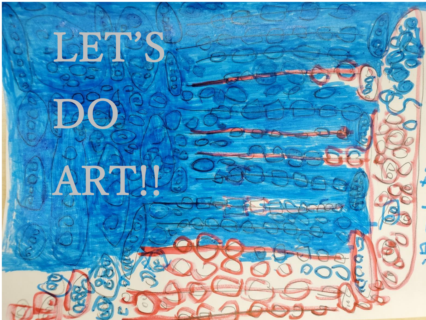
Theme ~ 稲穂 ~