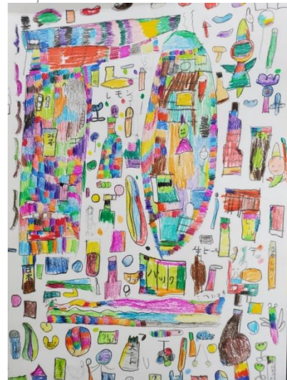
Theme ~ 日本酒 ~